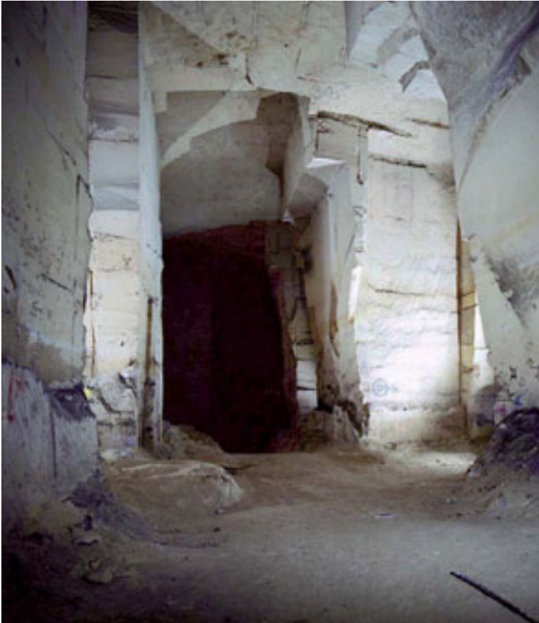
3 – MIDDELEEUWS GROENOVERSCHRIJDEND GROEVELANDSCHAP (15E EEUW) CAESTERTGROEVE, SINT PIETERSBERG