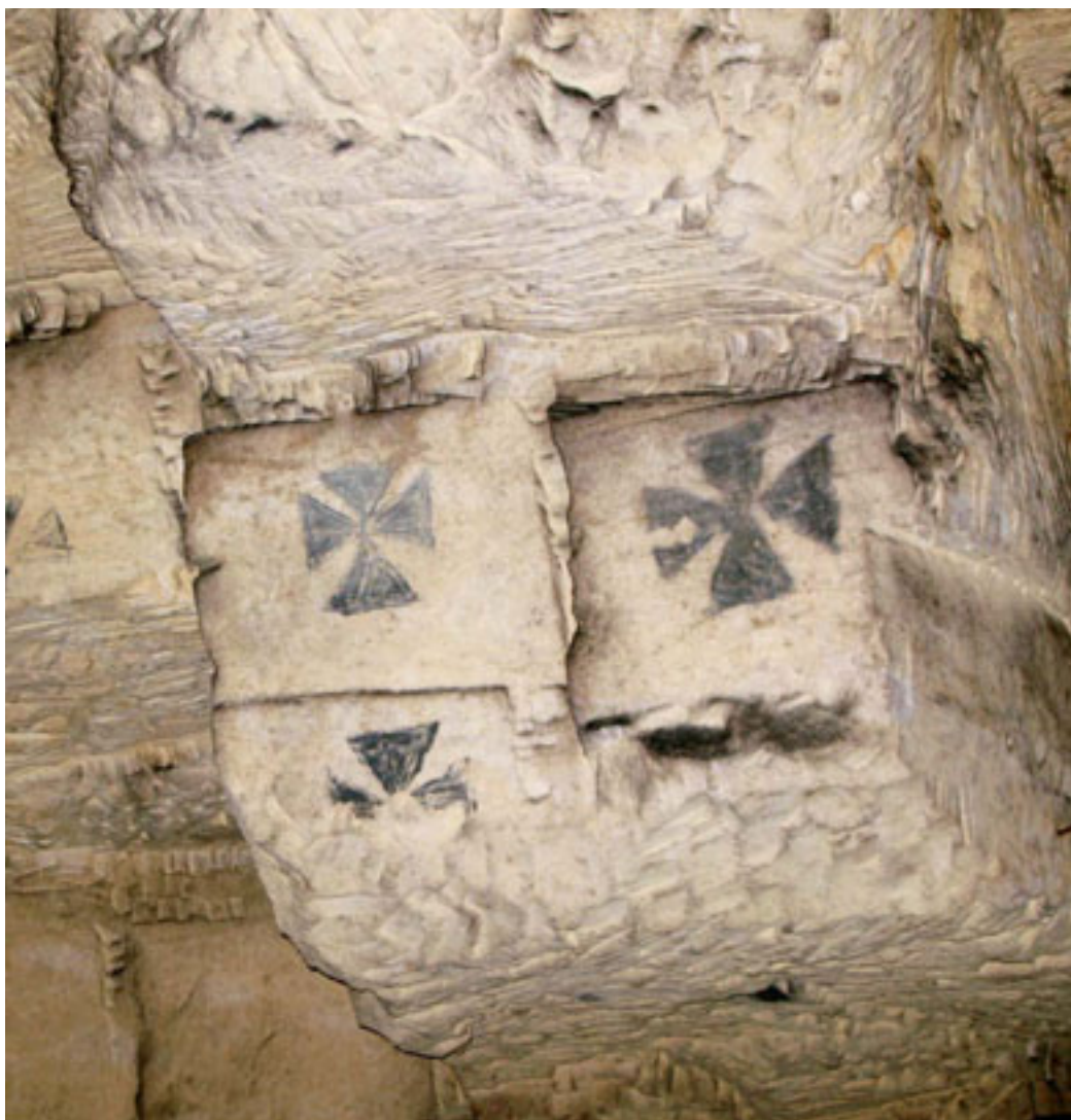
9 - 16E EEUWSE CONCESSIONSMARKERINGEN AAN HET EINDE VAN EEN ONTGINNING. GEMEENTEGROEVE, VALKENBURG AAN DE GEUL.

het ontsluiten van boven- en ondergrond als synthese van een gezamenlijke ontstaans- en ontwikkelingsgeschiedenis een ingewikkelde zaak wanneer het gaat om nationaal, regionaal en plaatselijk beleid ten aanzien van de verschillende onderdelen van zo een gebied. Illustratief is het voorbeeld van het Plateau van Caestert. Dit plateau ten zuiden van Maastricht maakt deel uit van de Sint Pietersberg, die van oudsher de grens vormt tussen twee taalgebieden c.q. culturen. Tegenwoordig lopen zelfs drie grenzen over het plateau; die tussen Nederland, Vlaanderen en Wallonië. Hoewel het terrasrestant zelf door de aanwezigheid van een groot potentieel aan erfgoedwaarden een UNESCO-werelderfgoedstatus waardig zou zijn, wordt het terrasrestant als zodanig niet als één geheel beschermd. Aan Nederlandse kant is het stukje Caestert, met ondergronds een groot areaal aan bijvoorbeeld middeleeuwse kunstuitingen op de wanden van de ondergrondse groeve niet beschermd.