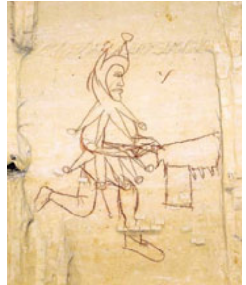
6 – LAAT MIDDELEEUWSE TEKENING VAN DE BLOKBREKER ALS NAR (15E EEUW). DE TEKENING IS MOGELIJK EEN SOCIAAL WAARMERK GEGEVEN DOOR EEN BUITENSTAANDER. FOTO: JAC DIEDEREN

Hoewel ontstaan als gevolg van het ingrijpen van de mens in het landschap, behoren dagbouwontginningen doorgaans eerder tot het aardkundig c.q. natuurkundig erfgoed dan dat zij tot cultuurhistorisch- of industrieel erfgoed worden gerekend. Dit heeft te maken met de