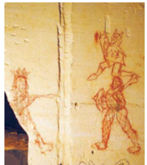
7 – LAAT MIDDELEEUWSE SYMBOLISCHE TEKENING DIE MOGELIJK VERWIJST NAAR INITIATIERITEN VAN DE BLOKBREKERS. CAESTERTGROEVE, SINT PIETERSBERG.

doorgaans hoger ingeschatte geologische waarden van de groeve als landschapselement. Als gevolg van mijnbouwactiviteit zijn doorgaans aardlagen aan de oppervlakte gebracht die men elders niet ziet. Het verschil in waardestelling is afhankelijk van de aard van de site, maar zeer zeker ook van de instantie die de site beheert. Onterecht worden deze plaatsen vaak eerder als geologisch- of zelfs natuurmonument gezien en worden de cultuurhistorische elementen van ondergeschikt belang geacht.