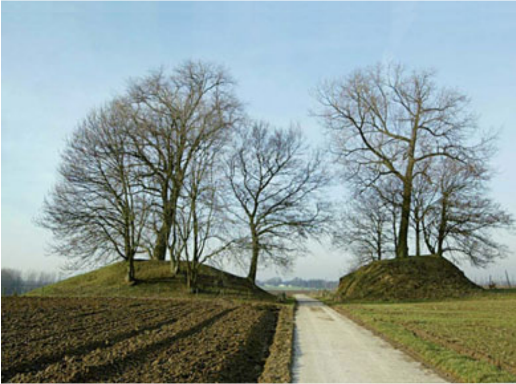
3 – GALLO-ROMEINSE TUMULI TE GINGELOM, MONTENAKEN.

zoeksveld landschap was dan ook één van de belangrijkste doelstellingen bij het opstellen van de Onderzoeksbalans Landschap.