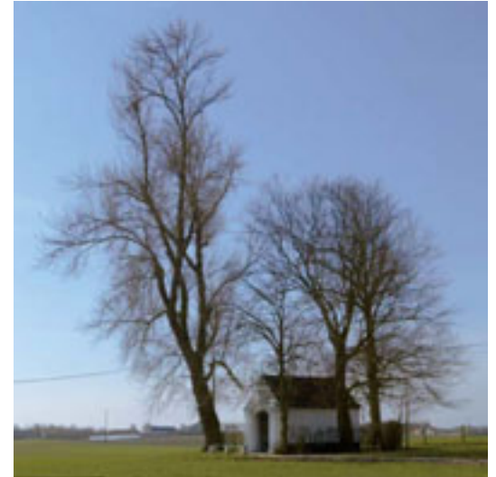
4 – KAPEL VAN ONS-HEREN-BOOMPJE TE POPERINGE (PROVINCIE WEST-VLAANDEREN). VLAANDEREN HEEFT NOG EEN GROOT AANTAL OUDERE BOMEN EN STRUIKEN DIE IETS VERTELLEN OVER DE GESCHIEDENIS VAN EEN BEPAALDE PLAATS, DIE VERWIJZEN NAAR OUDE BEHEERSTECHNIIEKEN OF DIE EEN OUD GEBRUIK ILLUSTREREN. HET VIOE INVENTARISEERT DEZE HOUTIGE BEPLANTINGEN MET ERFGOEDWAARDE.

Bij elk van de hoofdstukken werd een werkgroep opgestart voor het verzamelen van informatie en het uitwerken en verbeteren van de teksten. Elk hoofdstuk start met de ‘onder-