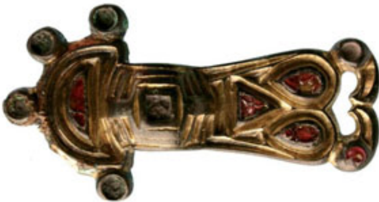
5 – BEUGELFIBULA, VIOE OPGRAVING MEROVINGISCHE GRAFVELD TE BROECHEM (PROVINCIE ANTWERPEN)

MARLEEN MARTENS is wetenschappelijk adviseur en coördinator Onderzoeksbalans Onroerend Erfgoed. ●