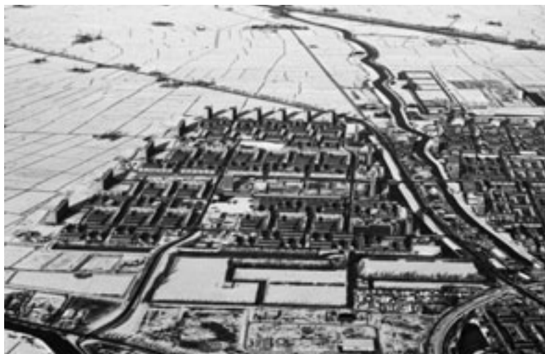
6 – FOTO UIT 1973, WAAROP CENTRAAL DE WIJK VINKHUIZEN EN ACHTER DE STRAKKE STADSGRENS NAAR DE HORIZON HET REITDIEP, HET VAN STARKENBORGHKANAAL EN MIDDAG-HUMSTERLAND.