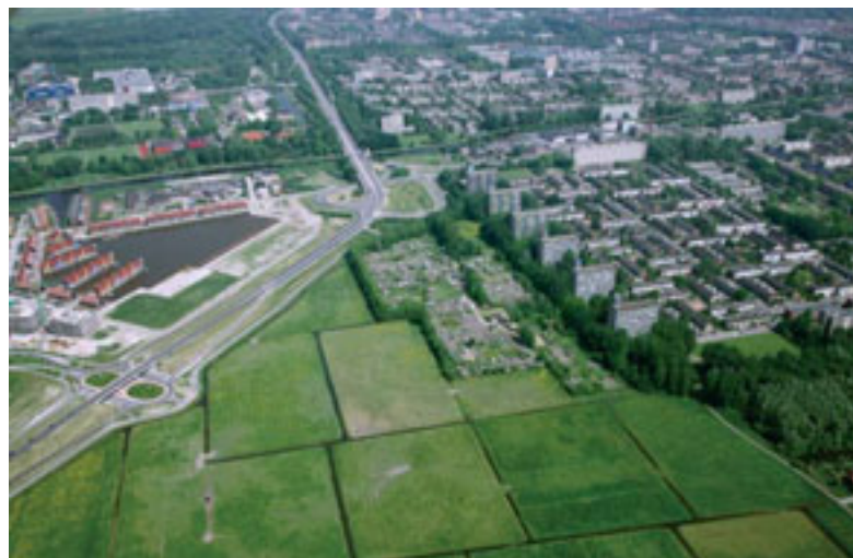
7 – FOTO VAN 25 MEI 2009: DE NOORDWESTELIJKE STADSRAND VAN GRONINGEN, MET RECHTS DE WIJK VINKHUIZEN EN LINKS DE RECENTE SPRAWL.

De archeologen hebben dat vrij goed voor elkaar, maar op het gebied van stedelijke en rurale landschappen en het gebouwd erfgoed is dat nog niet goed geregeld. De dienst moet de structuur ontwikkelen waarin lagere overheden van kennis worden voorzien. Kennisontwikkeling en kennisverspreiding zijn cruciaal.