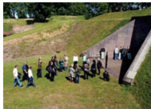
5 – DE EERSTE BIJENKOMST MET CREATIEVE ONDERNEMERS IN DE NIEUWE HOLLANDSE WATERLINIE MAAKTE VEEL ENTHOUSIASME LOS. HIER TIJDENS BEZOEK AAN WERK IV IN BUSSUM.

De eerste successen van de uitvoering van het project Nieuwe Hollandse Waterlinie zijn zichtbaar geworden en er vindt nu een confrontatie plaats met de weerbarstige uitvoeringspraktijk. Het Projectbureau Nieuwe Hollandse Waterlinie constateert zelf dat zij niet alle antwoorden klaar heeft liggen. Zij moet hierdoor op zoek naar wegen om de partners in de uitvoering te ondersteunen met kennisontwik-