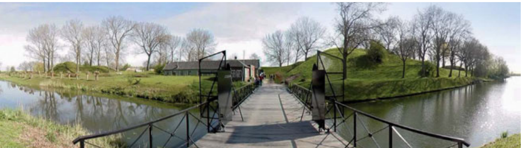
4 - INGANG FORT NIEUWE STEEG (GEOFORT) BEELD: BUREAU SLA

enkel fort of een afzonderlijk fietspad, en oog te hebben voor marktkansen en economische vitaliteit wordt bijgedragen aan de onaantastbaarheid en kwaliteit van het gebied.