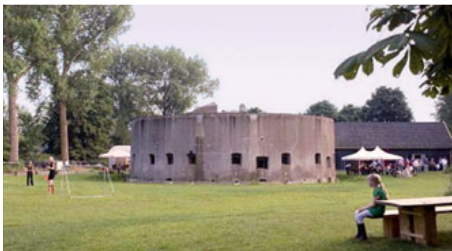
2 - FORT AAN DE KLOP

andere stedelijke agglomeraties. Behoud en versterking ervan zullen in de toekomst van beslissende betekenis blijken voor recreatie, toerisme en het internationale vestigingsmilieu. Liniebreed zijn er drie uitvoeringsambities: