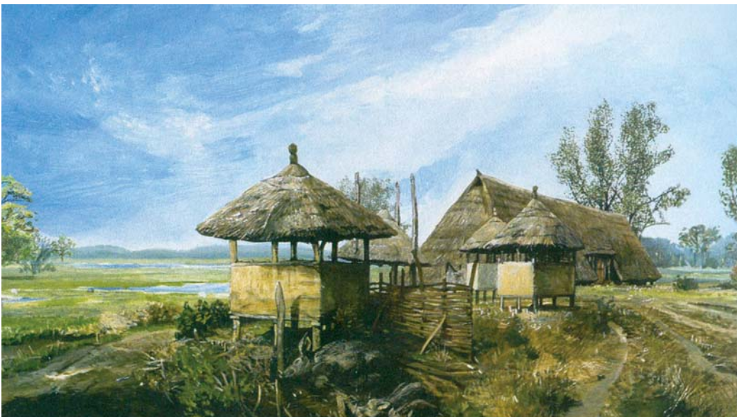
6 – VENSTER 3. BOERENGHEUCHT UIT DE IJZERTIJD IN HET RIVIERENGEBIED (KELVIN WILSON)