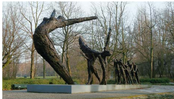
3 – HERINNERINGSKOORTS IN EUROPA. SINDS 2001 WORDT JAARLIJKS AANDACHT BESTEED AAN HET NEDERLANDSE SLAVERNIJVERLEDEN EN DE AFSCHAFFING VAN DE SLAVERNIJ. (NATIONAAL MONUMENT NEDERLANDS SLAVERNIJ-VERLEDEN)

begrippen te vinden wat iedere Nederlander zou moeten weten van natuurwetenschap en technologie. Tot grote tevredenheid van archeologen worden in deze canon twee begrippen behandeld die in hun vakgebied een grote rol spelen – 'de mens' en 'landbouw' – en die in de historische canon ontbreken of op een ongelukkige wijze worden besproken. Onder het kopje 'Weg van de Savanne' wordt in hoofdstuk 38 de geschiedenis van de menselijke voorouders beschreven. Hier vinden we wat in de historische canon om allerlei redenen het