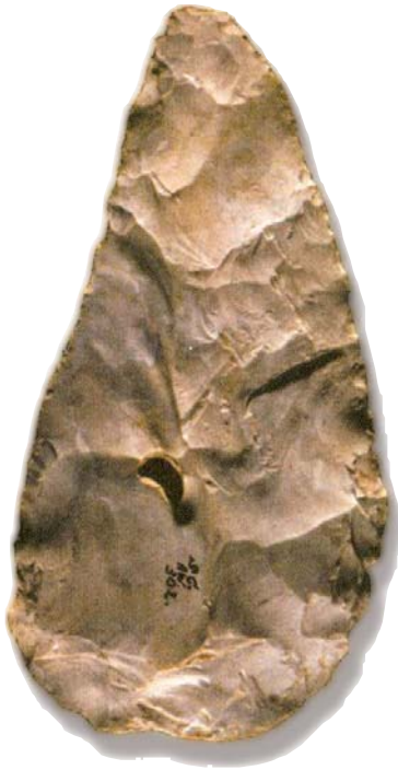
4 – VENSTER 1 - VUISTBIJL, MIDDEN PALEO-LITHICUM (OUDER DAN 150.000 JAAR), RHENEN

Het is hier niet de plaats om alsnog volledig vorm te geven aan de ontbrekende vensters voor de pre- en protohistorie van Nederland. Wel wordt een eerste aanzet gegeven. Om discussie uit te lokken, maar vooral om te laten zien waarom het verhaal over de pre- en protohistorie zo interessant én belangrijk is. Het kan ons een eerste houvast bieden als het gaat om de uiteenlopende waarden die bij elkaar komen in het op het eerste gezicht ongemakkelijke begrip ‘beschaafd nationalisme’.