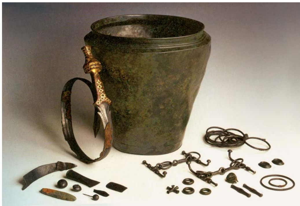
7 – VENSTER 4. ‘VORSTENGRAF’ VAN OSS, VROEGE IJZERTIJD

Het derde venster lijkt vertegenwoordigd in de historische canon. Het eerste venster heeft immers betrekking op de hunebedden en op de ‘revolutionaire’ overgang van een bestaanswijze die gebaseerd is op jagen, vissen en verzamelen naar een die is gebaseerd op landbouw. Toch kan bij dit venster een aantal kritische kanttekeningen worden geplaatst. Hoewel de hunebedden ongetwijfeld een bijzonder fenomeen vormen – en uiteraard moet iedere Nederlander weet hebben van het bestaan en de betekenis van hunebedden – mag niet de