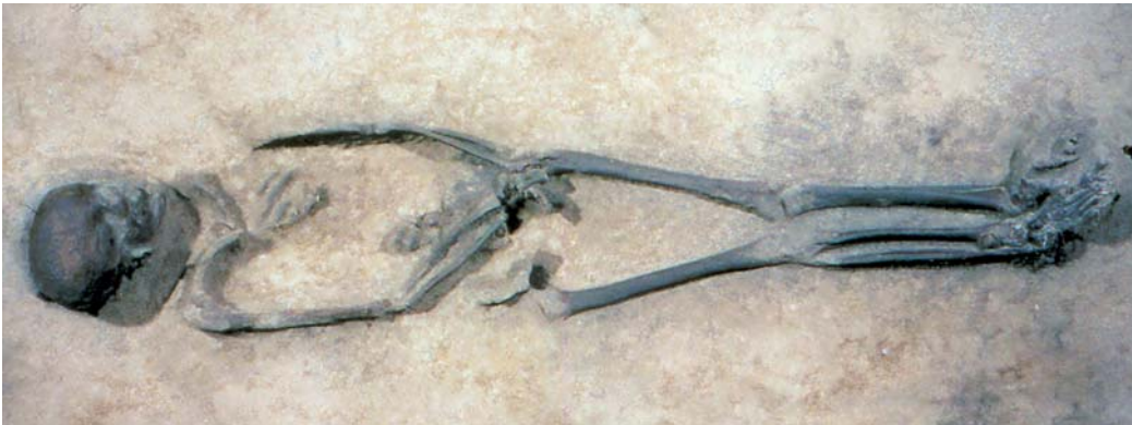
5 – VENSTER 2. ‘TRIJNTJE’, GRAF VAN EEN 40-60 JAAR OUDE VROUW, LAAT MESOLITHICUM, HARDINXVELD

In Europa trof de mens de Neanderthaler aan, een verwant uit het geslacht Homo , waarvan de mens zich in genetische, sociale en culturele zin fors onderscheidde; de wegen van beide soorten hadden zich immers al meer dan een half miljoen jaar geleden gescheiden. De Homo