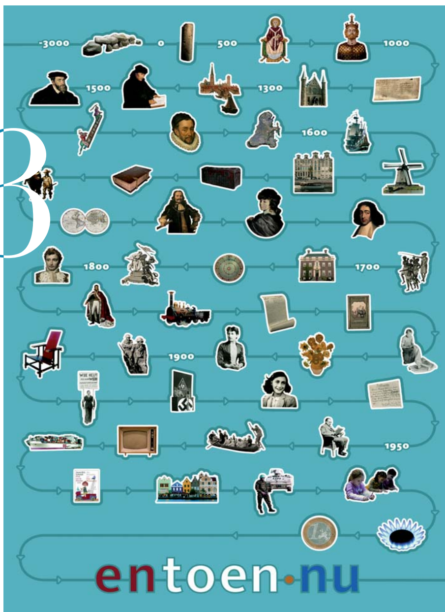
1 – DE HISTORISCHE CANON VAN NEDERLAND, 2006 (WWW.ENTOEN.NU)

'Teleurgesteld', zo kunnen we de reactie van veel Nederlandse archeologen typeren op de in 2006 in opdracht van de minister van OCW Maria van der Hoeven opgestelde historische canon. In vijftig vensters (figuur 1) werd een overzicht gegeven van 'het geheel van belangrijke personen, teksten, kunstwerken, voorwerpen, verschijnselen en processen die samen laten zien hoe Nederland zich heeft ontwikkeld tot het land waarin we nu leven'. Met twee vensters – hunebedden en de Romeins limes – speelt de archeologie van en in Nederland een beperkte rol. Archeologen moeten in mijn ogen geen investering plegen in een eigen canon. In alle bescheidenheid, zo zal ik in deze bijdrage laten zien, hadden archeologen wel minstens drie extra vensters kunnen bijdragen aan de officiële historische canon.