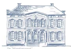
De 'Wierfvoort' Friso Woudstra Architecten bna

Op basis van de in het inspiratiedocument omschreven karakterleer heeft Res nova een reeks aanbevelingen opgesteld op basis waarvan Friso Woudstra Architecten haar plannen voor Bruinhorst heeft opgesteld. Hoewel de indeling van het huis niet volledig wordt teruggebracht tot de oorspronkelijke situatie (deze was al grotendeels verdwenen gedurende eerdere bouwactiviteiten), wordt in het ontwerp van Friso Woudstra wel een ambiance neergezet die past bij de historische grandeur van het gebouw. De aanwezige achzijdige salon zal hierbij weer als spil van het huis gaan dienen, zoals in de glorie-dagen van Bruinhorst.