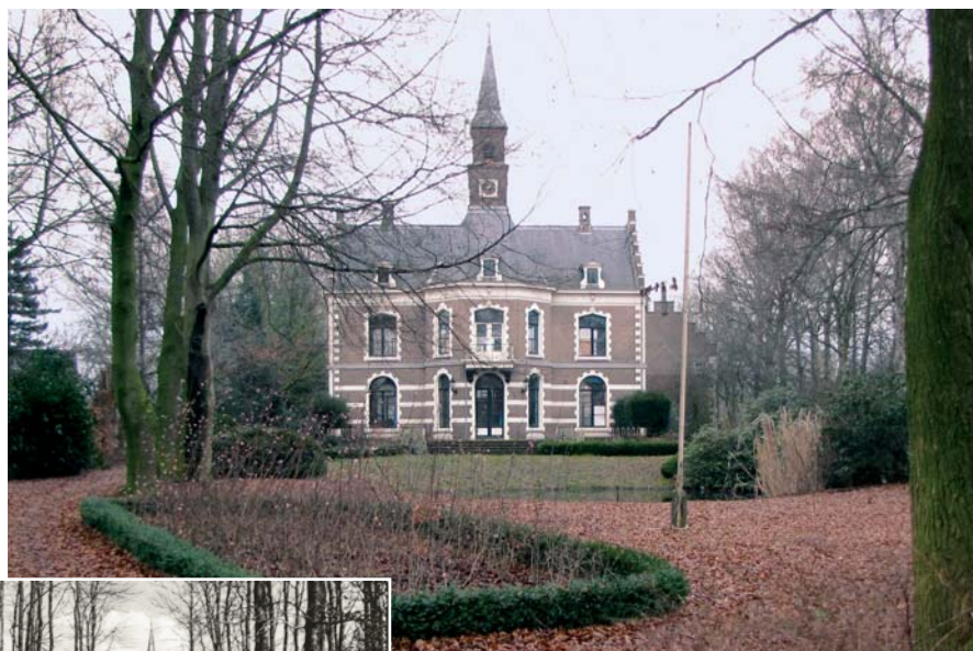
Kasteeltje Bruinhorst, gezien vanaf de Luntersekade.

Aan de hand van nog aanwezige bouwhistorische waarden en sporen en van bronnenonderzoek, waarbij vooral aandacht is besteed aan (historisch) beeld-