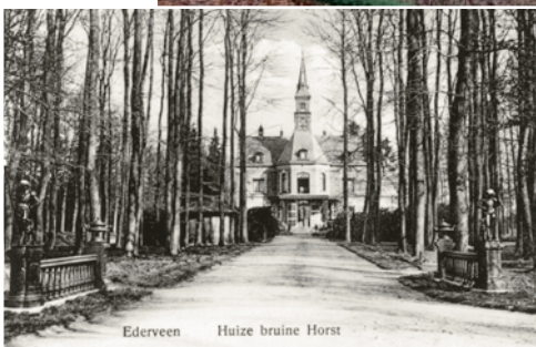
Bruinhorst anno 1910. Vanaf de straat was sprake van een rechte laan, gericht op de salon van het huis. De laan liep door een bosje.

materiaal van negentiende-eeuwse interieurs, is een beeld geschetst van de wijze waarop het interieur van Bruinhorst in haar glorie-dagen zou zijn uitgemonteerd. Hierbij speelde de 'karakterleer' een belangrijke rol. Deze leer was toonaangevend bij het inrichten van luxe interieurs in vooral het laatste kwart van de negentiende eeuw. Bij de karakterleer speelt de functie van het vertrek een belangrijke rol bij de aankleding. Salons en tuinkamers waren vaak in een lichte neoclassicistische stijl uitgewerkt. Stucwerk was vaak frivoool door het gebruik van florale motieven. De hal is de eerste indruk die bezoekers van een woning kregen en moet daarom imponeren. Centrale hallen kenden daarom meestal een ietwat zwaardere afwerking, waarbij sprake is van rijker aangezet stucwerk. Bij woonvertrekken is de uitvoering vrijwel altijd in een neoclassicistische stijl met lage lambriseringen en een licht kleurenpalet opgezet. Stucwerkplafonds bestonden vaak uit lijstwerk met centrale ornamenten, voorzien van een delicate detaillering. Eetvertrekken en andere meer private kamers als rookkamers, kenmerkten zich echter vaak door meer houtwerk (hogere lambriseringen) en zwaarder aangezette plafonds (stucwerk vaak uitgevoerd als lijstwerk met blinde