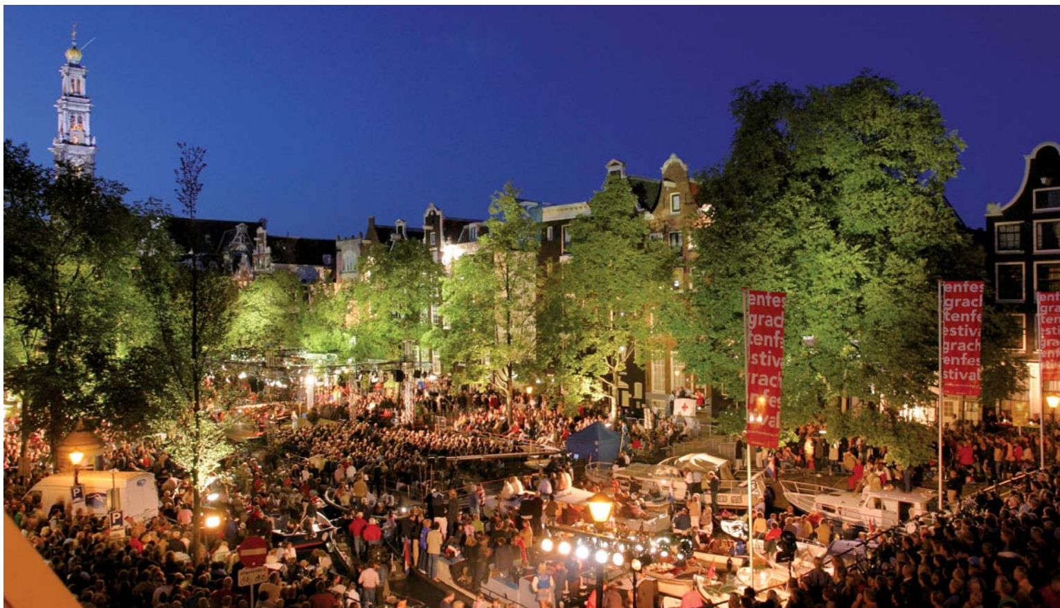
4 - DECOR VAN EEN BRUISENDE STAD.

negen wereldmonumenten op de Werelderfgoedlijst: het voormalig eiland Schokland en omgeving (1995); de Stelling van Amsterdam (1996); het molencomplex Kinderdijk-Elshout (1997); de historische binnenstad van Willemstad op Curaçao (1997); het Ir. D.F. Wouda (stoom)gemaal in Lemmer (1998); de droogmakerij De Beemster (1999); het Rietveld Schröderhuis in Utrecht (2000); de Waddenzee, als natuurlijk werelderfgoed ingediend samen met Duitsland (2009) en de Amsterdamse grachtengordel (2010) sluit deze indrukwekkende reeks.