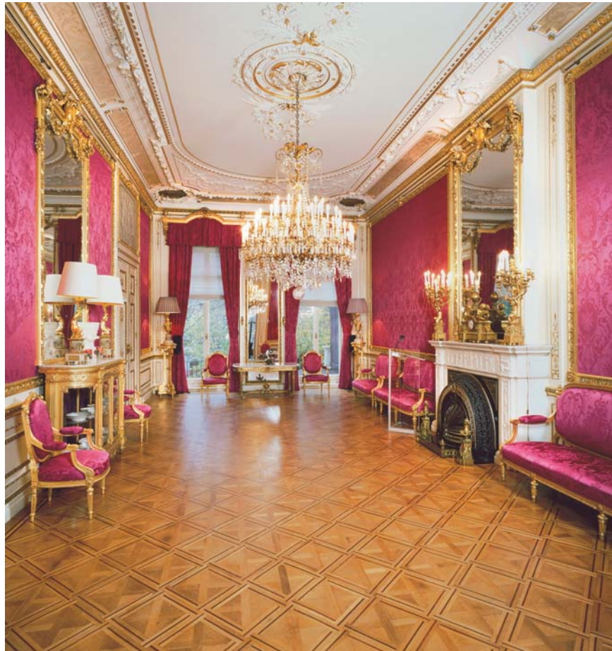
2 - BALZAAL IN DE AMBTSWONING VAN DE BURGEMEESTER VAN AMSTERDAM.