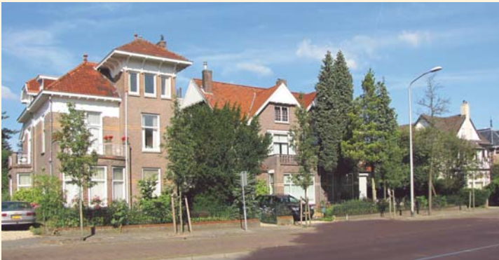
Groesbeekseweg, Nijmegen: boven straatbeeld en rechts nr. 238.

De nieuwe winkelpui is in opzet geïnspireerd op de oorspronkelijke drieledige situatie van het winkelgedeelte: een centrale entree met aan weerszijden een ruit, geplaatst op een lage borstwering. De nieuwe invulling kenmerkt zich door een vormtaal en vakmanschap die corresponderen met de nog aanwezige historische geveldelen. Bij de werkzaamheden werden achter de huidige pui de twee oorspronkelijke decoratieve hardstenen hoekpilasters aangetroffen. Hoewel deze ernstig waren aangetast door de vele geveelaanpassingen, is besloten deze in de huidige staat inzichtelijk te houden.