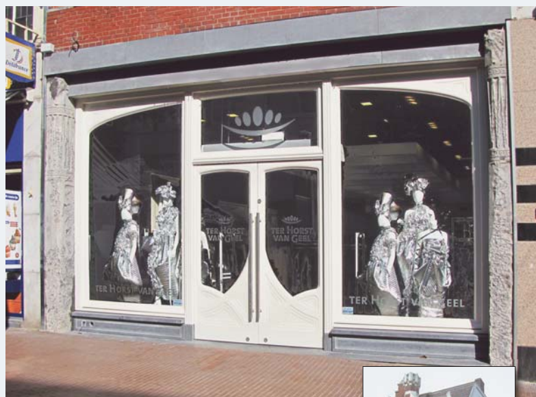
Molenstraat 72, Nijmegen: rechts vóór en boven ná de werkzaamheden.

Res nova heeft in opdracht van Friso Woudstra Architecten een cultuur- en bouwhistorisch rapport aangeleverd waarin de ontwikkelingsgeschiedenis van het pand is onderzocht en in zijn historische context is geplaatst. Aan de hand van de waardenstelling is een aantal aanbevelingen ('kansen en bedreigingen') geformuleerd op basis waarvan Friso Woudstra Architecten de plannen voor Molenstraat 72 heeft opgesteld. De rol van Res nova eindigt niet bij het aanleveren van een rapport. Ook gedurende het ontwerpproces is sprake van een intensieve samenwerking tussen architect en cultuurhistoricus.