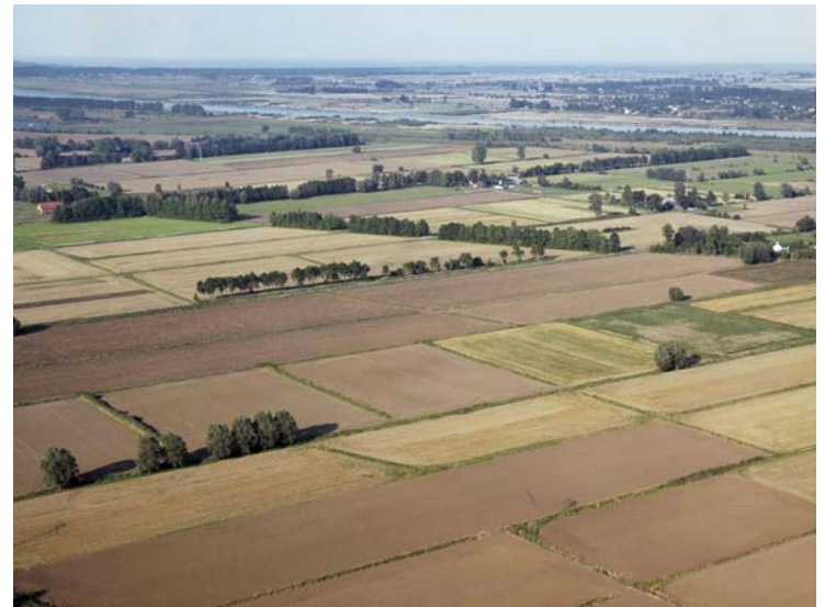
3 - HET RATIONEEL VERKAVELDE DELTAGEBIED MET OP DE ACHTERGROND DE RIVIER DE WIJSEL.

de Baltische fluit, verscheept. Het vormde een belangrijke basis voor de moedernegotie van de 17e-eeuwse Republiek. 6