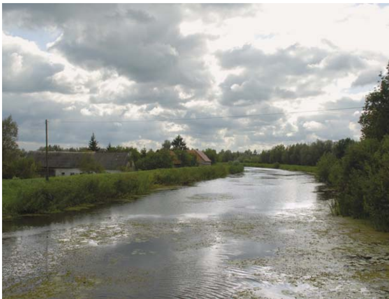
10 – AFWATERINGSKANAAL IN DE POLDER KLEIN-MARIËNBURG FOTO: CORTEN, 2008