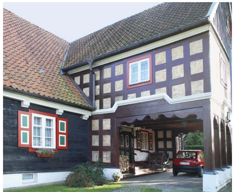
9 – GERESTAUREERDE ARCADEBOERDERIJ IN ŻUŁAWKY (VH. FÜRSTENWERDER) FOTO: CORTEN, 2008