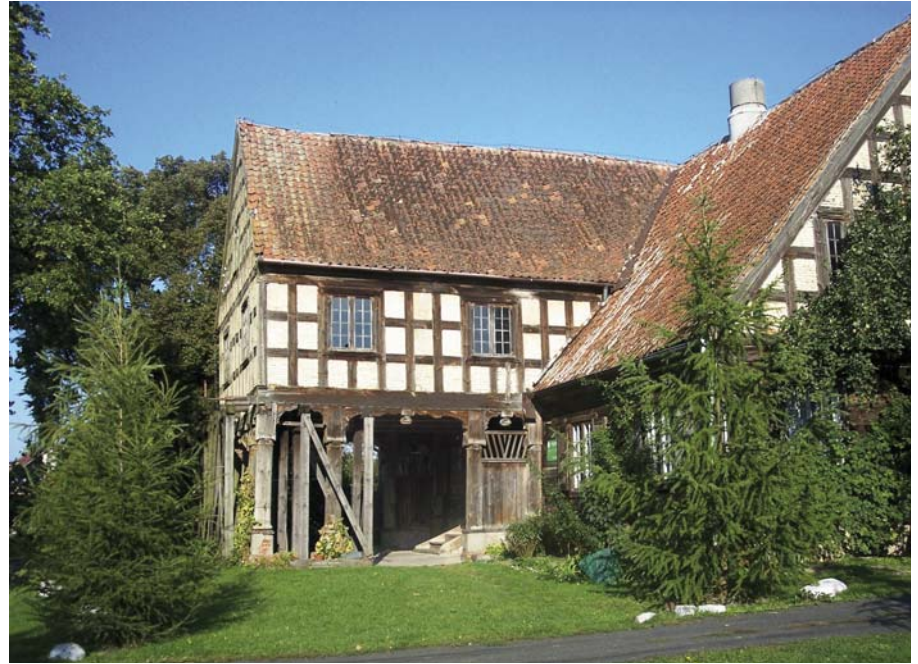
7 – ENTREE VAN DE ARCADE-BOERDERIJ IN MARYNOWY