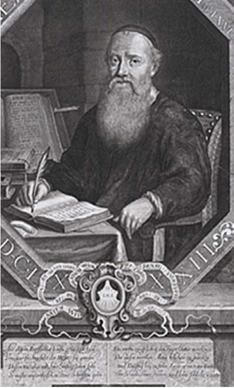
5 – MENNO SIMONS.

(met de daartoe behorende Wijsseldelta) elk historisch feit aan om de Germanisering te rechtvaardigen. Het ‘volkseigen’ karakter van de ‘Hollandse’ boerderijen vormde een dankbaar wapen in deze strijd. Het betekende een stimulans voor de restauratie en reconstructie van deze grote boerenhoeven, die zo karakteristiek zijn voor het gebied. 12