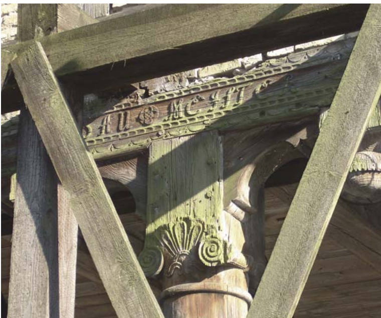
8 – DETAIL VAN KAPITEEL VAN ARCADEBOERDERIJ IN MARYNOWY FOTO: MAKER ONBEKEND, 2005

Het Nederlandse aandeel in de historische karakteristieken van de Wijseldelta is beperkt. Hij is vooral in de structuur van het landschap te herkennen; hij zit in de rationele verkaveling en het watermanagement. Ook de terpen in de laaggelegen delen hebben een