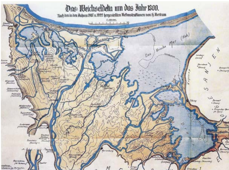
2 - KAART VAN DE WIJSELDELTA OMSTREKS 1300.