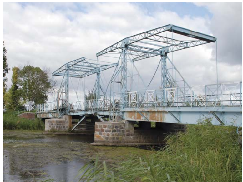
11 – IJZEREN OPHAALBRUG OVER HET AFWATERINGSKANAAL IN DE POLDER KLEIN-MARIËNBURG FOTO: CORTEN, 2008