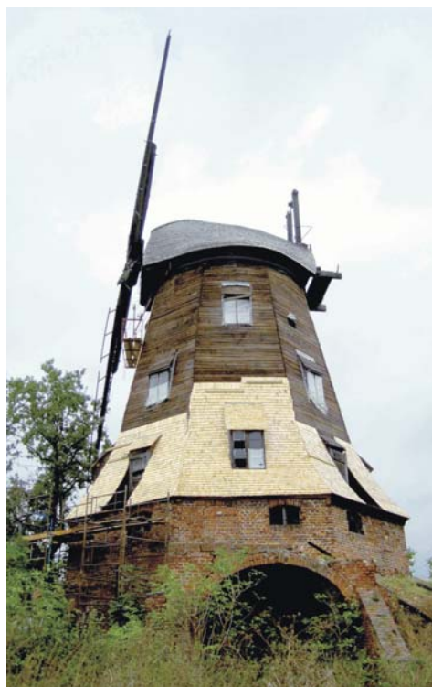
3 – DE DEELS GERESTAUREERDE BOVENKRUIER, TYPE 'HOLENDER', IN DREWNICA.