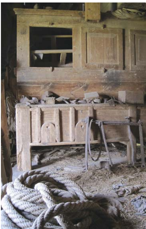
5 - DE KLOPBUIL MET MEELKIST IN DE STANDERDMOLEN VAN ZADAWA.

inmiddels is het interieur verwijderd en treedt verval genadeloos in.