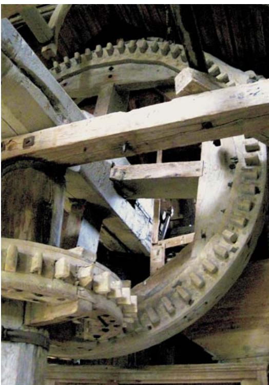
2 – BOVENWIEL MET DOORGESTOKEN KRUISARMEN IN DE PALTROKMOLEN VAN POSADA.

Dat functie prevaleerde boven schoonheid blijkt uit plooistukken van ruw bezaagde halve boomstammen. Maar ook was er ruimte voor rijk geprofileerde consoles of het fraai, met beplanking in ruitvorm, afgewerkte waaispant van de paltrok molen in Posada. Voor 5 jaar terug maalde deze molen nog op windkracht,