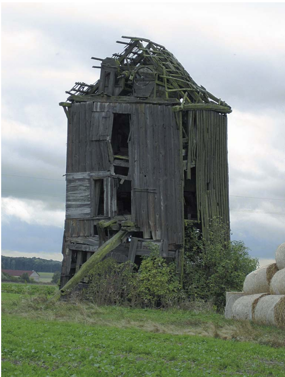
6 - DE STANDERDMOLEN TE KOTKOW IN RUINEUZE STAAT.

Vanwege de particuliere eigendomssituatie, de mechanisatieslag en de bakkers die tot op heden meel afnemen is deze bijzondere maalderij blijven bestaan.