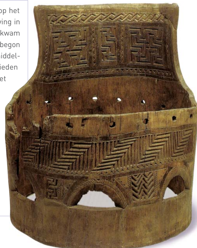
2 – Houten 'troon' afkomstig uit een graf te Fallward bij Feddersen Wierde, Duitsland. SCHÖN 1999

Van sommige van deze koningen, zoals Radbod en zijn voorganger Aldgisl, kennen we zelfs de naam. Verder weten we dat het Friese koninkrijk op een zeker moment het gehele Nederlandse en een groot deel van het Noord-Duitse kustgebied heeft omvat. Ook het Nederlandse rivierengebied behoorde gedurende enige tijd tot hun invloedssfeer. Zo resideerde de reeds genoemde Aldgisl enige tijd in Utrecht. De Friezen slaagden er geruime tijd in de machtsexpansie van het Frankische rijk te weerstaan. En uiteindelijk ontwikkelden de Friezen zich, weliswaar onder Frankisch gezag, gedurende de Vroege Middeleeuwen tot de belangrijkste handelaren in Noordwest-Europa.