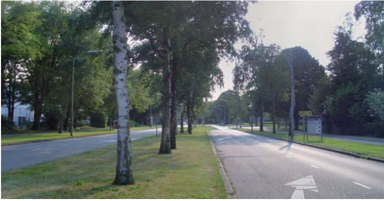
6 - KARAKTERISTIEK VOOR DE FUNCTIONALISTISCHE WOONWIJK ZIJN DE BREDE GEASFALTEERDE TOEGANGSWEGEN DIE HIER 'ORGANISCH' DEEL UITMAKEN VAN DE 'OPEN GROENE STAD': DE LOGISTIEK VAN DE WIJK WERD AFGESTEMD OP DE AUTO DIE TOEN NOG GEEN ONGEWENST ELEMENT VORMDE IN HET STRAATBEELD.