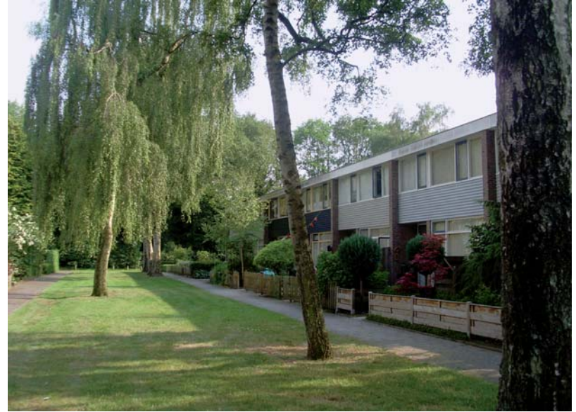
7 - DE 'OPEN GROENE STAD' VAN NIEK DE BOER GEEFT EEN REPRESENTATIEF BEELD VAN HET BELANG VAN DE NATUURLIJKE COMPONENT IN HET CONCEPT. OMDAT ELDERS IN NEDERLAND HET GROEN VAAK ALS EERSTE SNEUVELDE IN DIT SOORT WIJKEN HEEFT MEN IN HET ALGEMEEN EEN VERTEKEND BEELD WAARIN NIET GROEN MAAR GRIJS OVERHEERST. WAT ECHTER OOK DE BEDENKERS VAN HET EERSTE UUR VOOR OGEN STOND WAS EEN 'PLANTENSOCIOLOGIE', WAARBIJ PLANTENGEMEENSCHAPPEN, OFTEWEL GROEPEN VAN PLANTEN DIE ONDER NATUURLIJKE OMSTANDIGHEDEN BIJ ELKAAR GROEIEN ALS VORMGEVEND ELEMENT IN DE GROENE CONTEXT WERDEN INGEZET. DE HIERDOOR VERSTERKTE EENHEID TUSSEN MENS, STAD EN LANDSCHAP, ZOU DE TEGENSTELLING TUSSEN STAD EN LAND VERMINDEREN.

2001). In dit materiaal deden zich echter drie categorieën kennisleemten voor waardoor de waardenstelling bemoeilijkt werd: