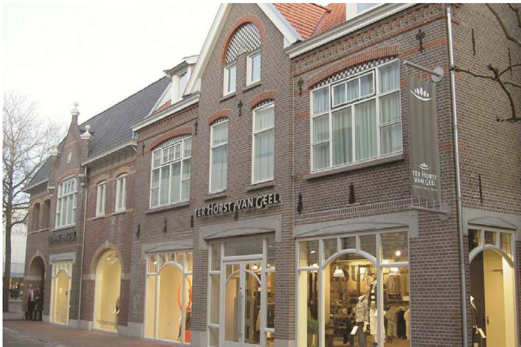
Gevelwand te Oss: rechts het gemeentelijk monument, links de nieuwe aanbouw in historiserende vormtaal

den, de speklagen van rode verblendsteen en de opvallende tandlijst onder de bakgoot. Het tegen het historische pand staande volume uit de jaren tachtig stak sterk af tegen de kwaliteiten van het gemeentelijk monument. Dit uitte zich met name in de korrelgrootte, de geslotenheid van de verdieping en het materiaalgebruik. Het gecreëerde monotone beeld zocht bewust het 'conflict' op met het aangrenzende rijk gedetailleerde gebouw.