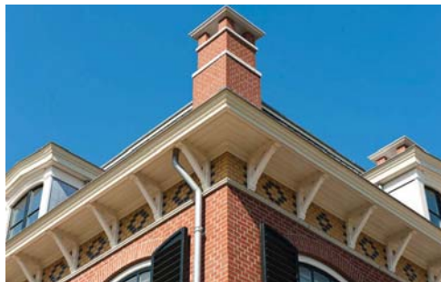
Detail van het woonhuis te Doetinchem: oog voor (historisch correcte) details

Tot de grootschalige verbouwing en uitbreiding bestond het complex uit een gemeentelijk monument en een in de jaren tachtig opgetrokken volume. Het monument is opgetrokken in eclectische stijl, waarbij de vormgeving van de Hollandse renaissance bepalend is voor het totaalbeeld van het pand. Het gebouw telt drie vensterassen, waarbij de entree in de centrale, ietwat uitkragende as is geplaatst. Dit risaliet wordt bekroond door een steekkap. Opvallende details zijn de geglazuurde tegels in de boogvel-