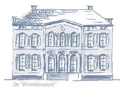
De Wierjevoot Friso Woudstra Architecten bna