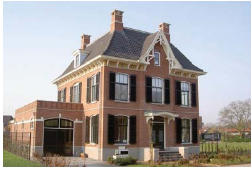
Nieuw woonhuis te Doetinchem: eclectische vormtaal

Ieder jaar wordt in Gelderland de 'Architectuur Prijs Achterhoek' georganiseerd. Hierbij wordt zowel een vakjuryprijs als een publieksprijs overhandigd. Friso Woudstra Architecten bna kreeg voor de Architectuur Prijs Achterhoek 2011 een tweede plaats in de publieksprijs overhandigd voor zijn ontwerp van een historiserende nieuwbouwwoning te Doetinchem. De eerste prijs is naar de verbouwing van een monumentale boerderij te Didam gegaan.