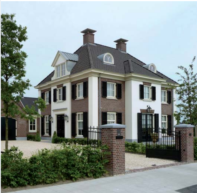
Ook dit classicistisch geïnspireerde huis, ontworpen door Friso Woudstra, kreeg een plaats in het boekwerk 1001, uit 2009.

Ook anderszins laat Watertuinen zien dat Belvedere nog lang niet is geland. In de enkele historische pas-