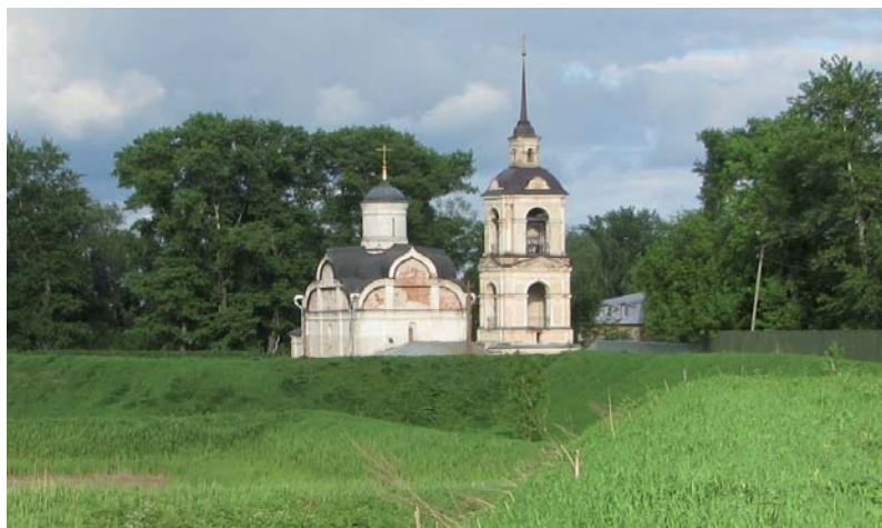
3 – De Sint-Isidoruskerk (1566) is sinds de aanleg van de wallen ingesloten in het meest noordoostelijk gelegen bastion van de vestingstad.

werden gebouwd. De succesvolle campagne van de Pools-Litouwse troepen zal hebben bijgedragen aan het besef dat deze verdedigingsmethode niet effectief is wanneer een vijand over modern geschut beschikte. Om de noodzakelijke vestingbouwkundige vernieuwingen in Rusland door te voeren nam men buitenlandse ingenieurs in dienst, zoals ook in het verleden bijvoorbeeld al Italianen waren aangesteld om de muren van het Kremlin in Moskou te ontwerpen (1485-1495).