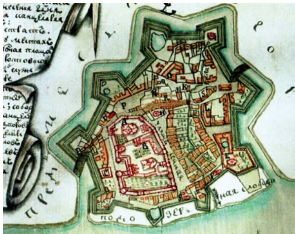
2 – Detail van de oudste kaart die een redelijk betrouwbaar beeld schetst van de vestingstad Rostov (ca. 1756). Opvallend is dat de toegangswegen in de flanken zijn geplaatst. Hoewel dit uitzonderlijk is, zijn hier in Nederland ook voorbeelden van te vinden.

door een Nederlands ingenieur ontworpen. Het doel van de missie was om te achterhalen of de Nederlandse invloed nog herkenbaar aanwezig is en om samen met de Russische partners het toekomstperspectief van de historische vesting te verkennen.