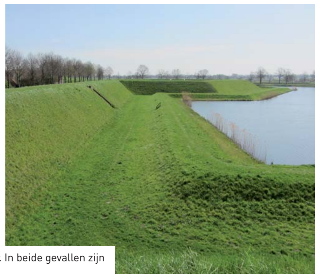
5-6 – De tracés van de vestingsteden Heusden en Rostov zijn goed vergelijkbaar. In beide gevallen zijn de principes van het 'Oud-Nederlands stelsel' toegepast.