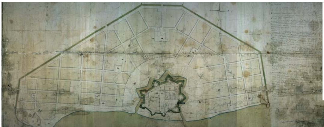
7 – Deze kaart toont het 18e eeuwse plan om het straten patroon van Rostov te rationaliseren zoals dit uiteindelijk ook grotendeels is uitgevoerd. De rechte straten binnen de vesting, de buffer rond de wallen en het radiale stratenplan van de buitenwijken zijn hier al te zien.

graven. Dit tafereel vormt een groot contrast met de situatie in het noordoosten van de stad, waar de vesting het best bewaard is gebleven en waar de opzet van het gebastioneerde systeem nog verassend goed kan worden beleefd. Het lijkt erop dat de compactheid van de lokale aarde ervoor heeft gezorgd dat de wallen, ondanks het gebrekkige onderhoud, hun profiel hebben behouden. Het moerassige land en de beschermde status van de groenstrook die zich direct buiten de wallen aan de landzijde bevindt, hebben er tot dusver voor gezorgd dat zich geen bebouwing opdringt langs de buitenzijde van dit deel van de wal.