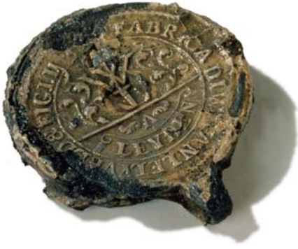
2 – Een textiellood uit Leiden.

schip raakte uit koers, liep op een rots, maar een zware zee zette haar er overheen. Er werd een anker uitgebracht en de bemanning begon zoveel mogelijk lading aan land te brengen. Op de Finse kust bij Turku stonden conservatoren van de Hermitage klaar om de nat geworden schilderijen op te vangen en te verzorgen. Enkele dagen later – op 9 oktober 1771 – zonk het schip alsnog en verdween het naar een diepte van veertig meter, want de pompen konden het instromende water niet meer weg krijgen mede door het vrij rondstromen van de lading suiker en koffiebbonen. Een deel van de kunstwerken werd geborgen, maar niet die van de tsarina.