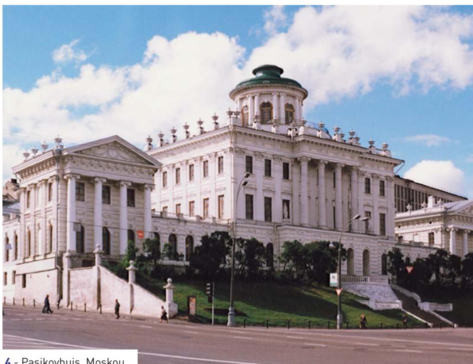
4 - Pasjkovhuis, Moskou.

We hopen dat de speciale editie van het tijdschrift Vitruvius, die gewijd is aan de samenwerking op het gebied van behoud van gezamenlijk cultureel erfgoed van Nederland en Rusland, ons gemeenschappelijke historische verleden en ook Nederlands onderzoek over Rusland, op belangstelling van de lezers kan rekenen en bevorderlijk zal zijn voor de ontwikkeling van een vruchtbare samenwerking tussen geleerden van onze landen en voor een beter inzicht in de processen die