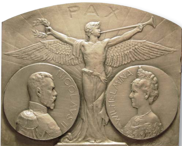
3 - Plaquette van de Tweede Haagse Vredesconferentie uit 1907.

Een goed voorbeeld van gezamenlijke activiteit van Russische en Nederlandse historici is de samenwerking tussen het Instituut voor Algemene Geschiedenis van de RAW en het Internationale Instituut voor Sociale Geschiedenis (IISG) in Amsterdam. In het beginstadium, midden jaren negentig, werd het idee ontwikkeld voor het uitgeven van een aantal innovatieve onderzoekswerken over sociale geschiedenis in het Russisch en ook voor het vormgeven en ontwikkelen van deze onderzoekstak in Rusland. Het Instituut voor Algemene Geschiedenis van het RAW nam samen met het Instituut voor Russische Geschiedenis van de RAW en de Moskouse