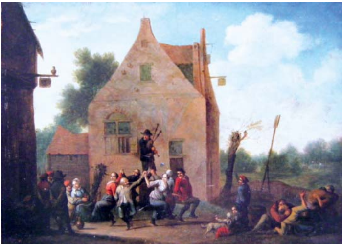
5 – Hendrick de Pooter, Dansende Boeren , M.A. Vrubel Museum, Omsk.