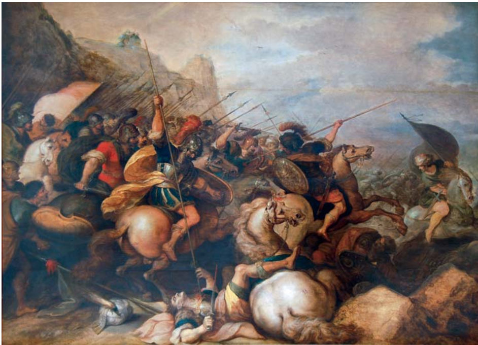
4 – Frans Francken de jonge, De slag tussen de Israëlieten en de Amalekieten , A. Kasteev Art Museum, Almaty, Kazachstan.