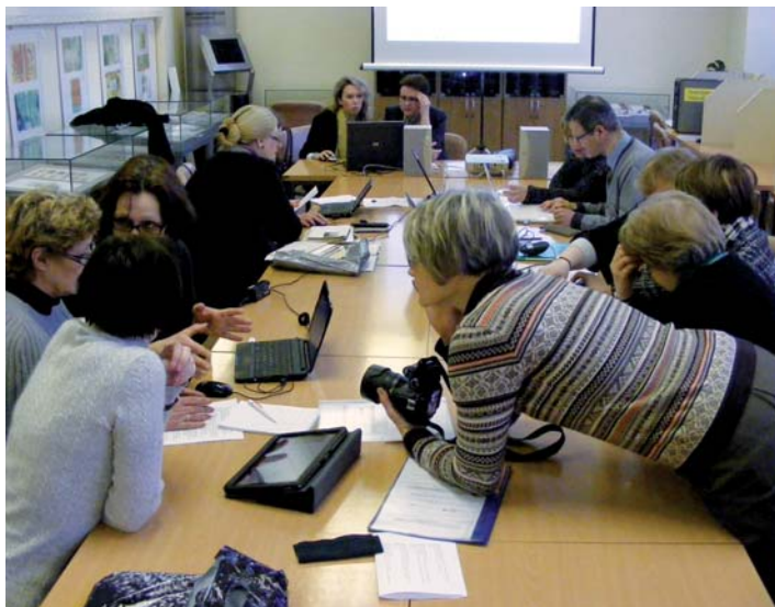
2 – Digitaliseren van museumcollecties tijdens de conferentie Gemeenschappelijk Russisch-Nederlands Cultureel Erfgoed, Koeskovo 2012.

Digitaliseren, documenteren, publicaties, tentoonstellingen en het geven van seminars voor beheer en behoud van de collecties zijn de activiteiten die de stichting ontplooid. SCI is een non-profit organisatie.