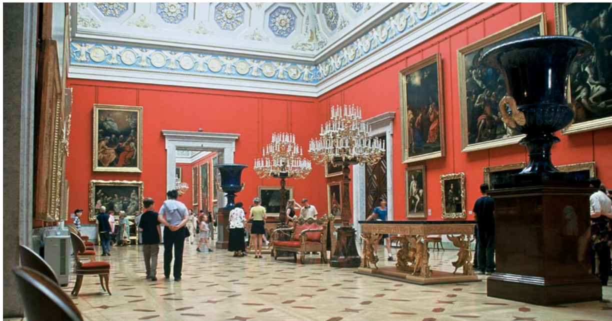
1 – Hermitage, Sint-Petersburg. Foto: Barbara Mensink, 2004.

Kunsthistoricus bij Stichting Cultuur Inventarisatie