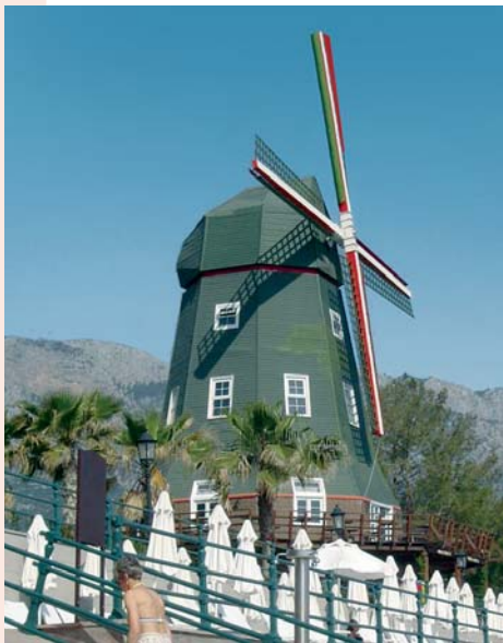
1 HOTEL ORANGE COUNTY KEMER, TURKIJE

Al enige tijd is er een (soms felle) discussie gaande naar aanleiding van de toespraak die prof. dr. J.G.A. Bazelmans van de RACM heeft gehouden op het RACM-symposium over molens op 10 oktober 2007 en die integraal is opgenomen in Vitruvius nummer 2, januari 2008.