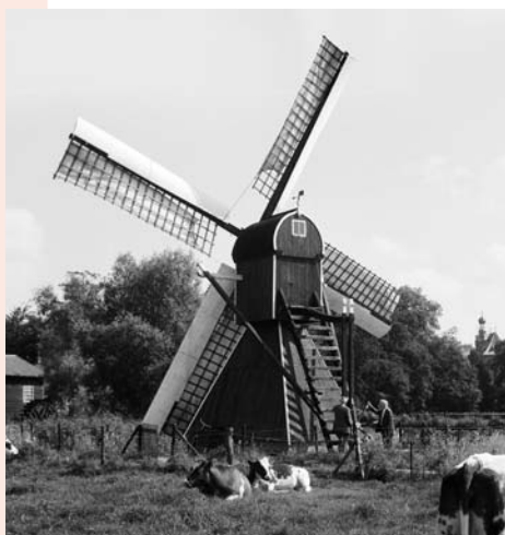
6 SPINNEKOP MOLEN TE LAAG KEPPEL

Voor de ca. 500 molenrestanten is enkele jaren geleden rijksbeleid vastgesteld. De visie daarop is door de toenmalige RdMz duidelijk verwoord. De niet-beschermden restanten komen ook niet meer voor rijksbescherming in aanmerking en hoeven dus in dat verband geen punt van aandacht meer te zijn. Al tientallen jaren, zeker sinds de jaren zestig, kwamen er op de Rijksdienst rompen voor herstel af. Om redenen van externe zowel als interne aard is er uiteindelijk een rijksbeleid