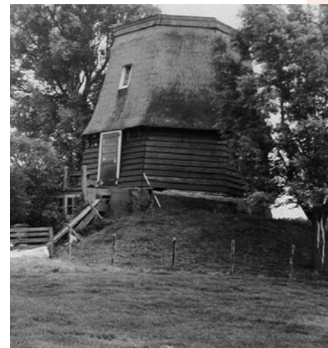
3 4 5 MOLEN VAN DE ETERSHEIMBRAAKPOLDER FOTO'S: (3) P. GRUND, 1984 / (4) AGNES OOMEN, 2000 / (5) ARIE DE KONING, 2000