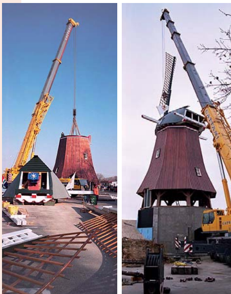
2 MOLEN DE IMMIGRANT (IN AANBOUW 2000) FULTON, ILLINOIS (VS)