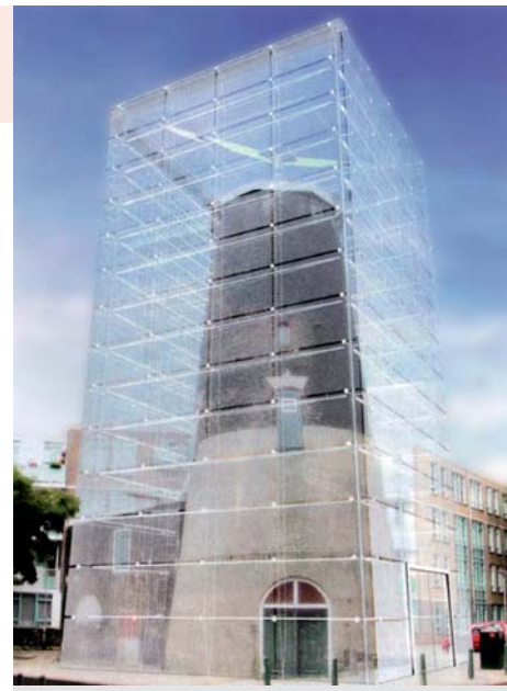
8 GLAZEN OMHULSELS VOOR MOLENSTOMPEN UIT DELFSHAVEN. 'MOLENS' 82, 6-7

het al genoemde geval van Laag-Keppel met zijn Friese spinnekop is dat wel het geval, maar dat is dan ook slechts een van de weinige gevallen van een minder geslaagde verplaatsing (maar toentertijd waarschijnlijk de enige mogelijkheid het molentje fysiek te redden). Zorgen over de vermeende musealisering van het platteland zijn o.i. overbodig en bovendien is deze term misplaatst. In weinig landen is het platteland zo verstedelijkt als hier en lijkt het platteland in zijn algemene verschijningsvorm (nieuwbouw, agrarische bedrijfsgebouwen, industrieterreinen e.d.) zo sterk op de meer verstedelijkte gebieden als in ons land. Er is op ons platteland heel weinig museaals te ontdekken op kleine gebiedjes als bijv. De Zaanse Schans en museumdorp Orvelte en nog wat van zulke speldekoppen na.