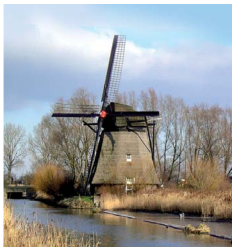
7 DE MOLEN IN WADENOIJEN