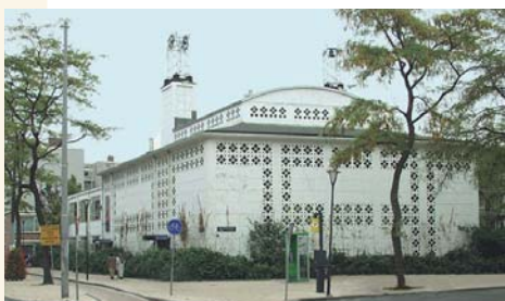
TWEE VOORBEELDEN: DE PNIELKERK (BOVEN - 1954, AMSTERDAM-WEST) TOT VOOR KORT GEBEDSHUIS VAN DE GEREFORMEERDE KERK - NU INTERNATIONAAL CULTUURPODIUM, EEN HUISARTSENPOST, KANTOOR-, STUDIO- EN ATELIERRUIMTEN.