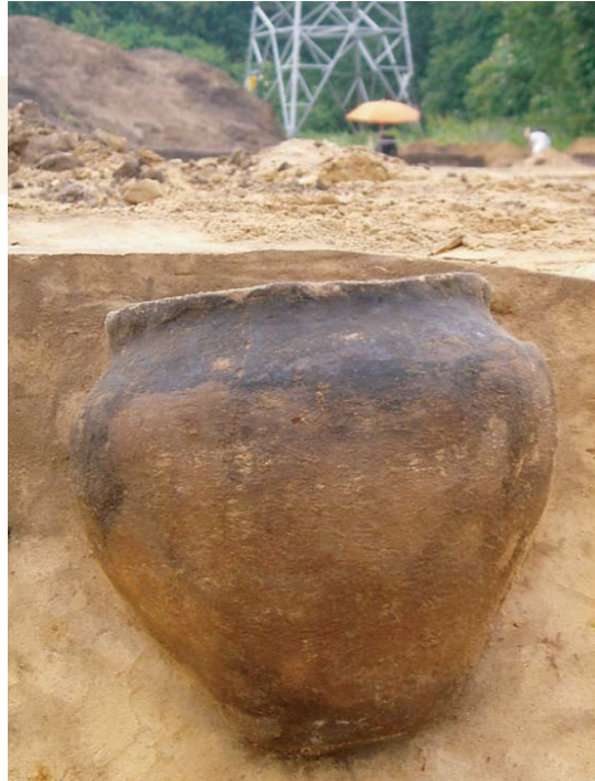
EN VERFSTREPEN OP DE HALS EN RAND.

Van de onderzochte personen bleek het sterftepatroon natuurlijk te zijn; de kindersterfte was hoog, evenals de sterfte in de leeftijds-klasse van 20 tot 40 jaar.