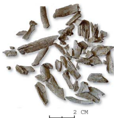
4 CREMATIERESTEN VAN EEN KIND

Helaas was het aantal te onderzoeken individuen te klein om uitspraken te kunnen doen over de gehele populatie van het grafveld.